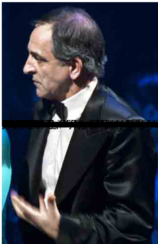
NO SE SIEMPRE ESTO CONMUNICA GAS, BAL

Miércoles, 22 de Febrero de 2012 16:38 - Actualizado Miércoles, 29 de Agosto de 2012 18:25