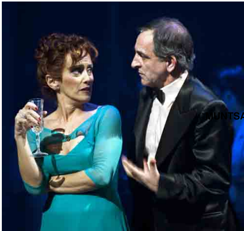
MUNTSÀ RIUS / PEP MOLINA

Miércoles, 22 de Febrero de 2012 16:31 - Actualizado Miércoles, 29 de Agosto de 2012 18:25