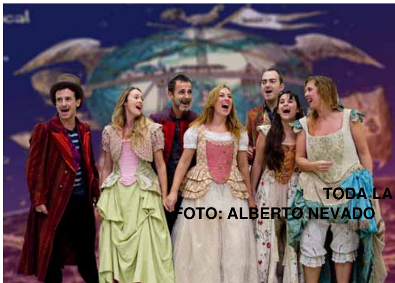
TODA LA COMPAÑÍA

Lunes, 24 de Diciembre de 2012 18:09 - Actualizado Lunes, 24 de Diciembre de 2012 18:34