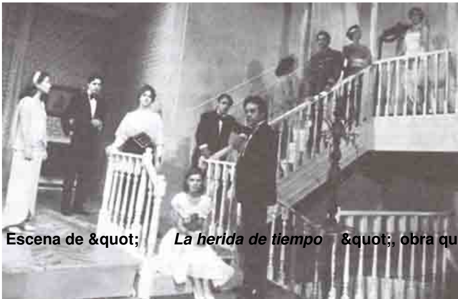
Escena de &quot; La herida de tiempo &quot;; obra que en actual cartelera teatral española

Lunes, 23 de Enero de 2012 16:05 - Actualizado Lunes, 23 de Enero de 2012 17:02