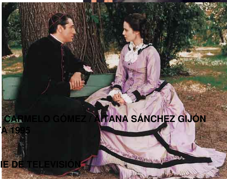
CARMELO GÓMEZ / AITANA SÁNCHEZ GIJÓN