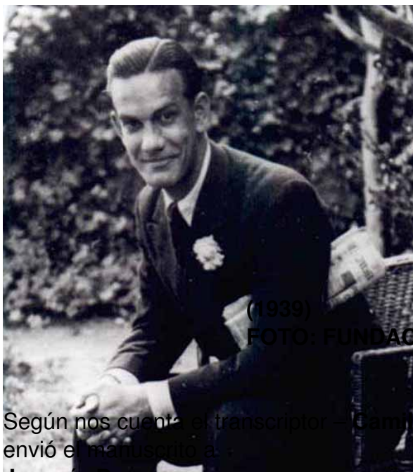
CAMILO JOSÉ DE CELA