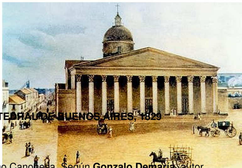
CATEDRAL DE BUENOS AIRES, 1829