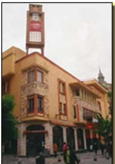
Teatro Pavón - www.madridteatro.net (R002-1521) 15 33

Jueves, 02 de Febrero de 2012 11:03 - Actualizado Miércoles, 29 de Agosto de 2012 18:29