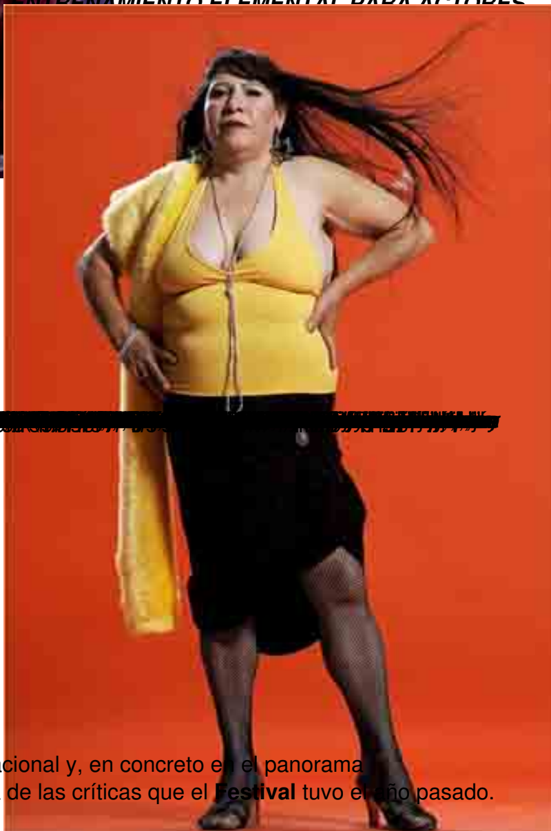
ENTRENAMIENTO ELEMENTAL PARA ACTORES