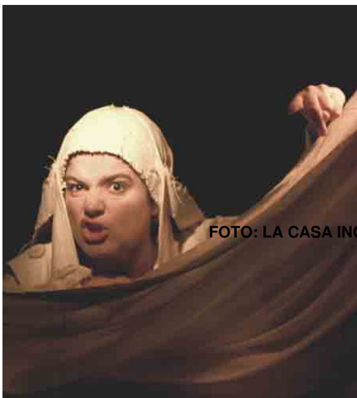
FOTO: LA CASA INCIERTA

Estreno en Madrid: Teatro Fernán Gómez, 27 - XII - 2011