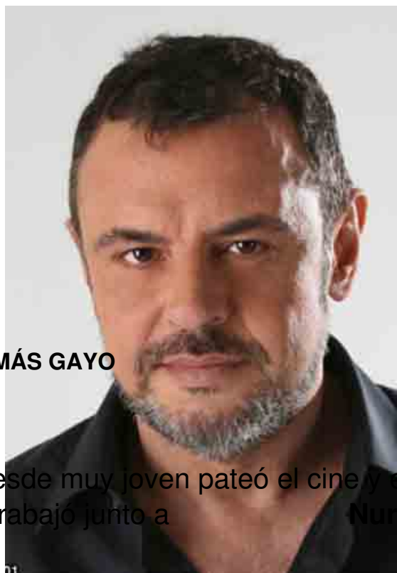
TOMÁS GAYO FOTO. PRODUCTORA

Tomás Gayo (Madrid, 4 – III - 1960), desde muy joven pateó el cine y el teatro. Tras varias temporadas en que trabajó junto a Nuria