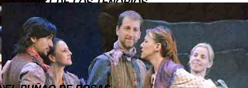
EL PUÑAO DE ROSAS