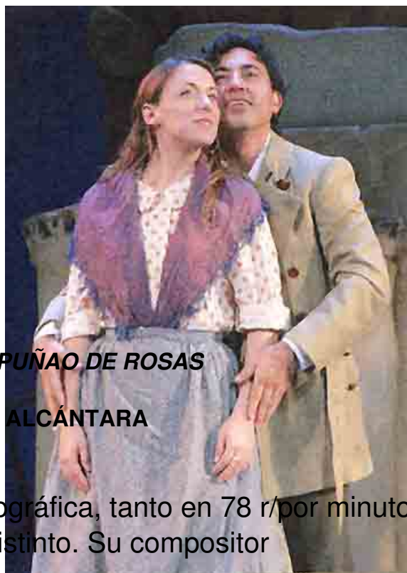
EL PUÑAO DE ROSAS