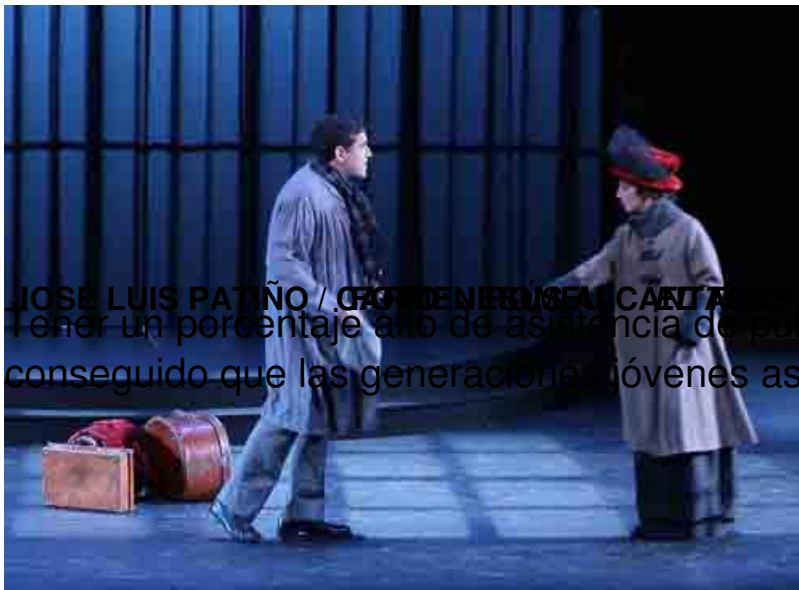
JOSE LUIS PATIÑO / FOTODIARIO EN EL CASTELLANO DE LOS TENORIOS

Tener un porcentaje alto de asistencia de público es bueno, pero no se ha conseguido que las generaciones jóvenes asistan a ver el espectáculo.