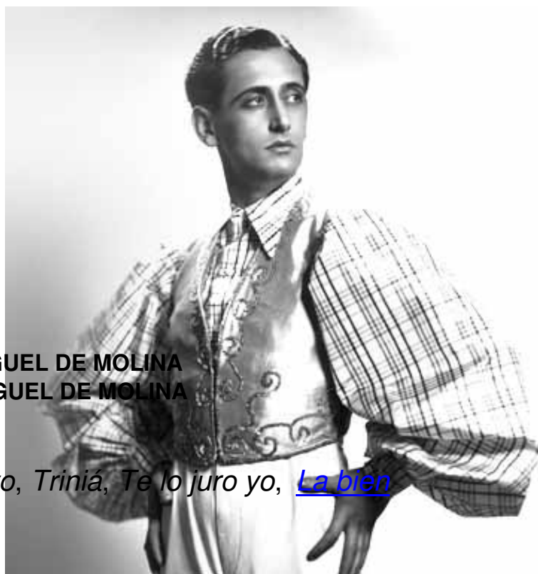
MIGUEL DE MOLINA

Las coplas suyas son: El día que nací yo , Triniá , Te lo juro yo , La bien pag&aacute;cute;