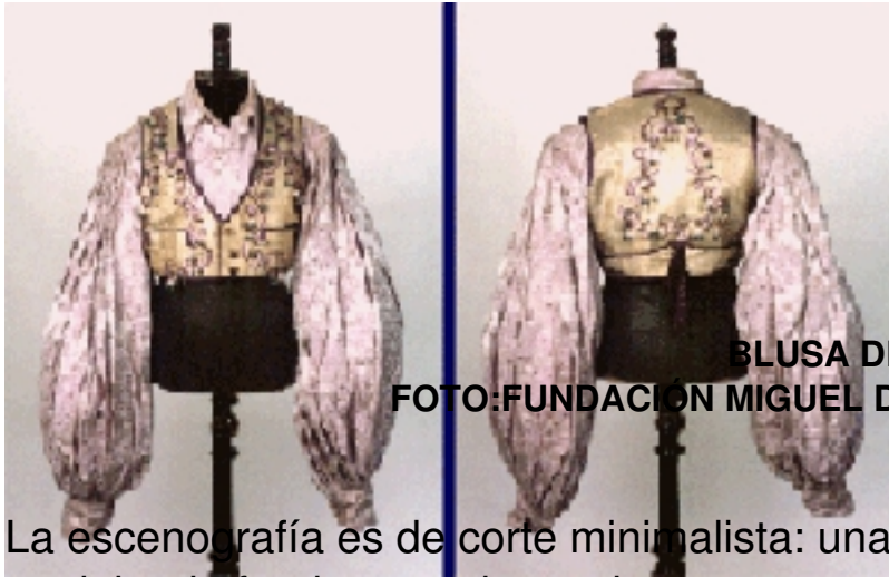
BLUSA DE MIGUEL DE MOLINA

La escenografía es de corte minimalista: una tarima de 4 x 3 metros, una cortinita de fondo como los antiguos teatros, un balancín y tres sillas. El resto se encomienda a la iluminación de Sergi Cervera .