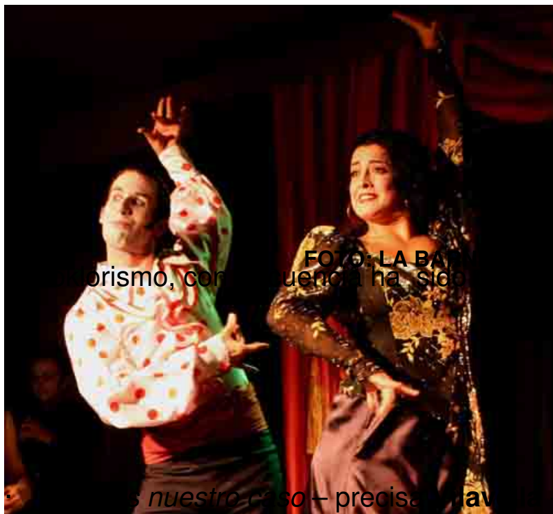
Actualizado.

... nuestro caso – precisa – si hay algo de caricatura es entre 0 y poquísimo. Lo tratamos desde un punto de vista muy honesto. No somos puristas como bailaores y cantaores, así como tampoco pretendemos imitar a