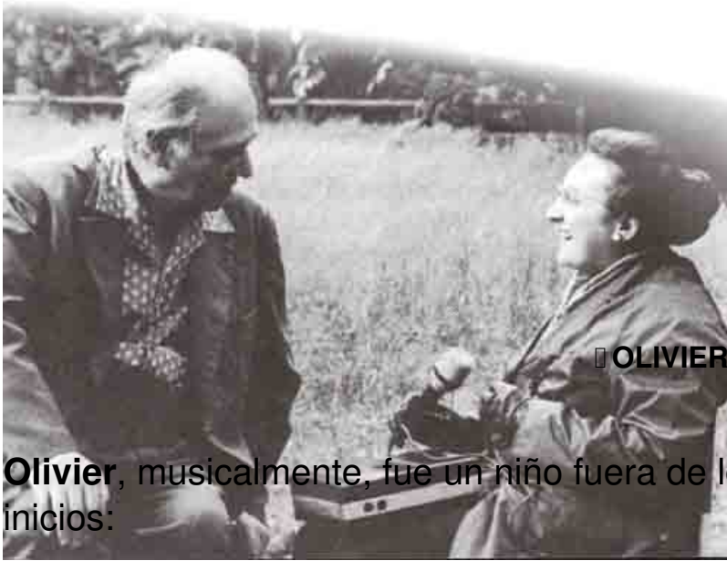
■ OLIVIER MESSIAEN

Olivier , musicalmente, fue un niño fuera de lo común. Él mismo narra sus inicios: