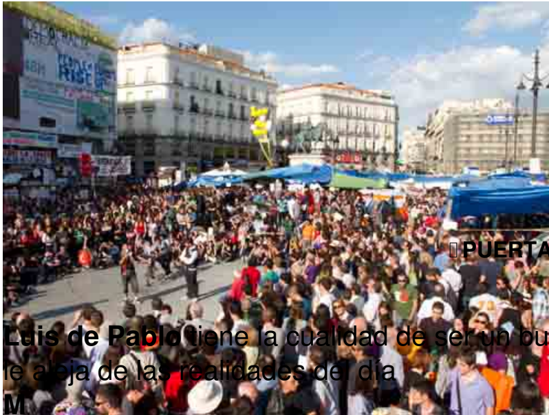
■ PUERTA DEL SOL. MADRID. 15 M

Luis de Pablo tiene la cualidad de ser un buen conversador y la música no le aleja de las realidades del día a día. Una de ellas es el 15 M.