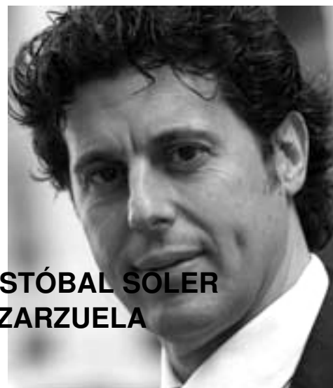
CRISTÓBAL SOLER FOTO: TEATRO DE LA ZARZUELA

Restaurada la Zarzuela grande, ésta, a partir de los años 30, volvió a los escenarios, con influencias de lo que se llamó: “comedia lírica”. Así se le denominó ya en 1923 a Doña Francisquita ,