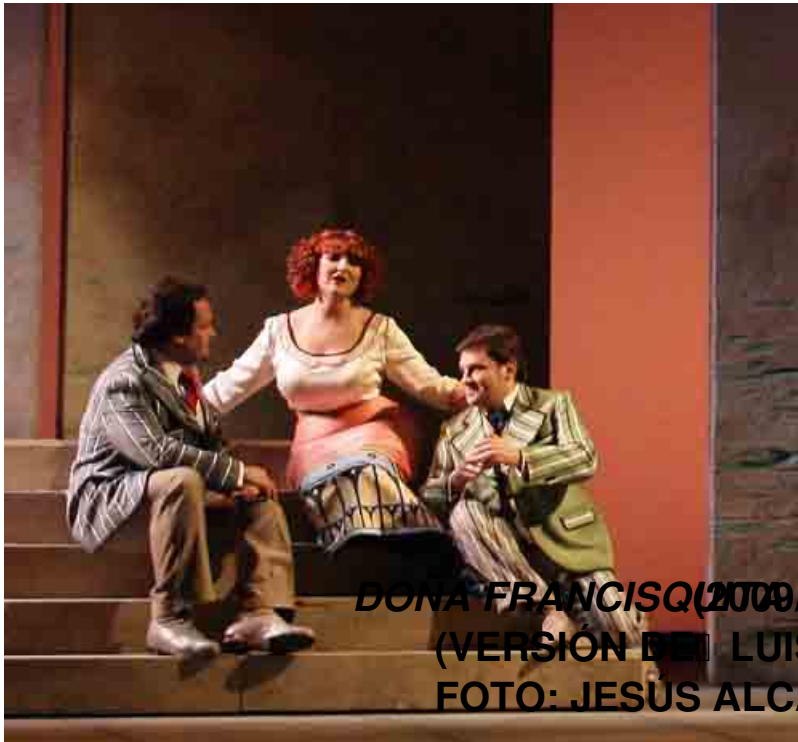
DONA FRANCISCA (2009/10)