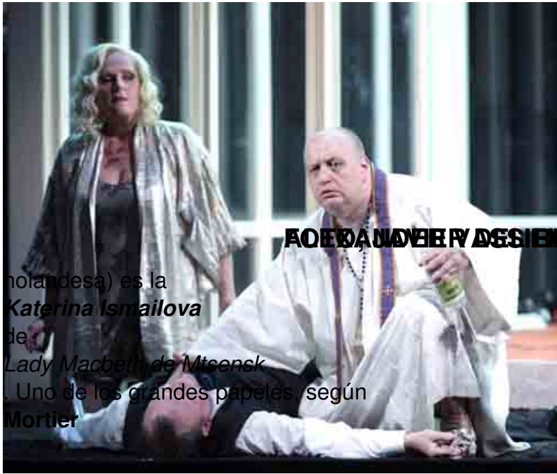
AOEDAN DUFFY / DESIENAL MARIA WESTBROEK / VLADIMIR (soprano)

Miércoles, 07 de Diciembre de 2011 16:38 - Actualizado Miércoles, 21 de Diciembre de 2011 12:29