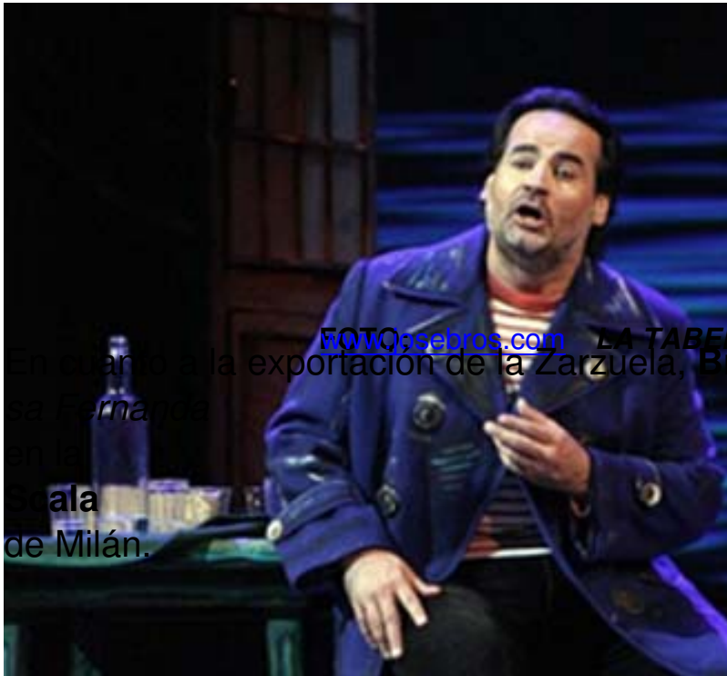
LA TABERNA DEL PUERTO) En cuanto a la exportación de la Zarzuela, Bros es optimista. Ya se hizo Luisa Fernanda en la Scala de Milán.