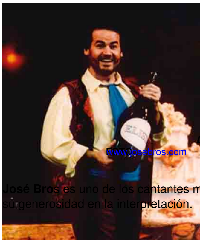
L'ELISIR D'AMORE (NEMORINO)

José Bros es uno de los cantantes mimados y queridos. Es el resultado de su generosidad en la interpretación.