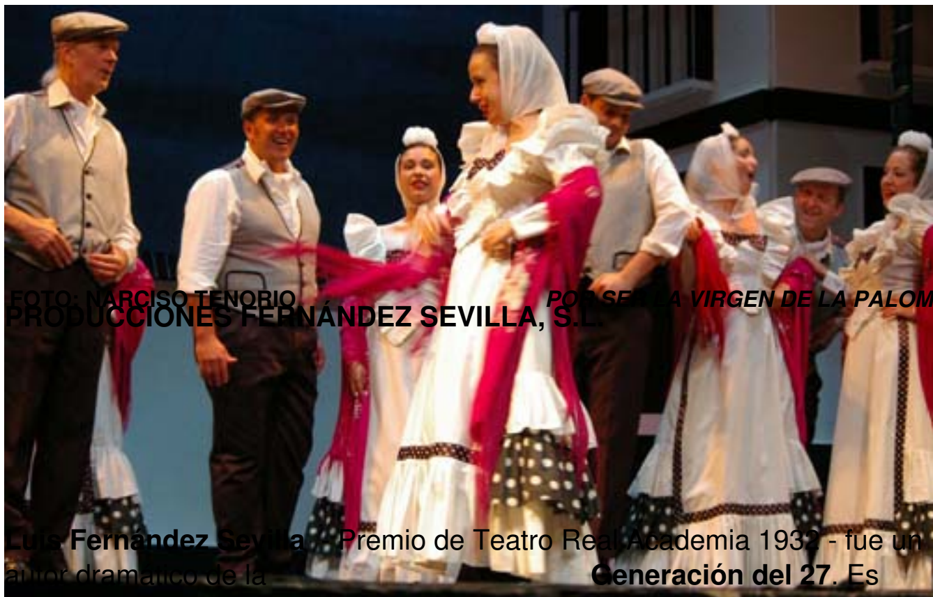
PRODUCCIONES FERNÁNDEZ SEVILLA, S.L. POR SEVILLA VIRGEN DE LA PALOMA...