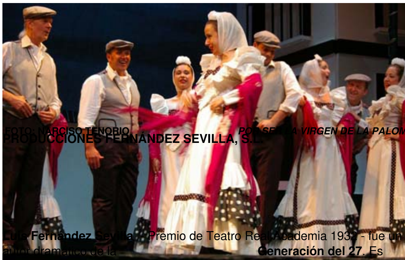
PRODUCCIONES FERNÁNDEZ SEVILLA, S.L. POR SEVILLA VIRGEN DE LA PALOMA...

Luis Fernández Sevilla / Premio de Teatro Real Academia 1932 - fue un autor dramático de la Generación del 27 . Es autor, también, de zarzuelas y posee títulos que han quedado en repertorio: La del soto del Parra