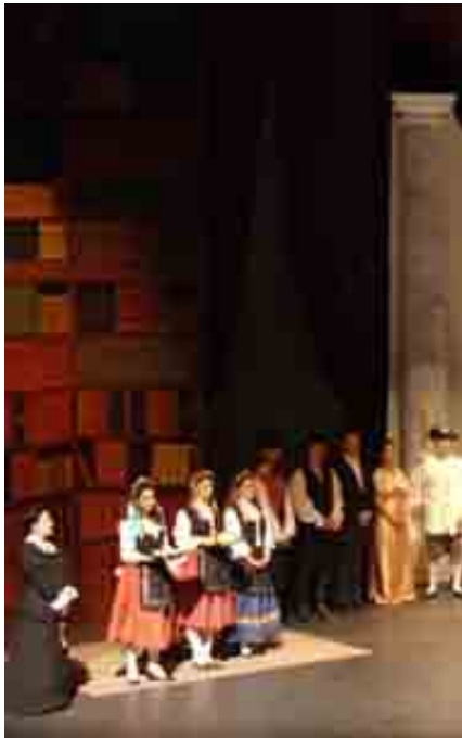
BLACK EL PAYASO