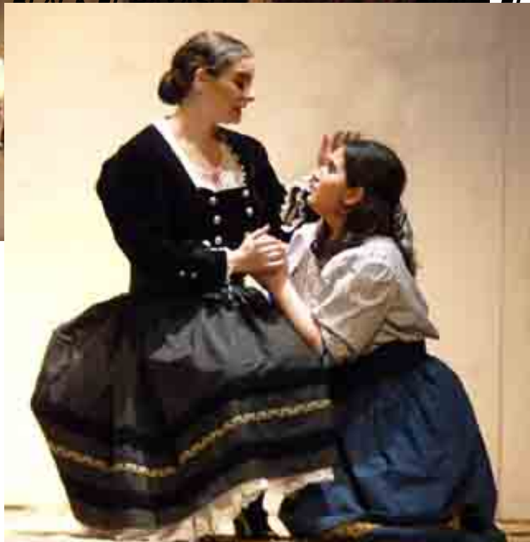
LOS GAVILANES