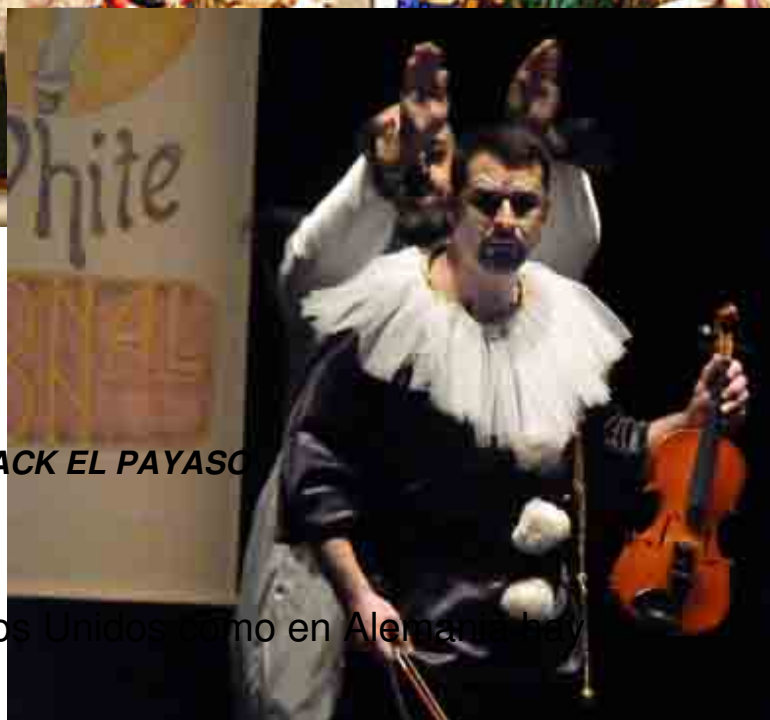
BLACK EL PAYASO