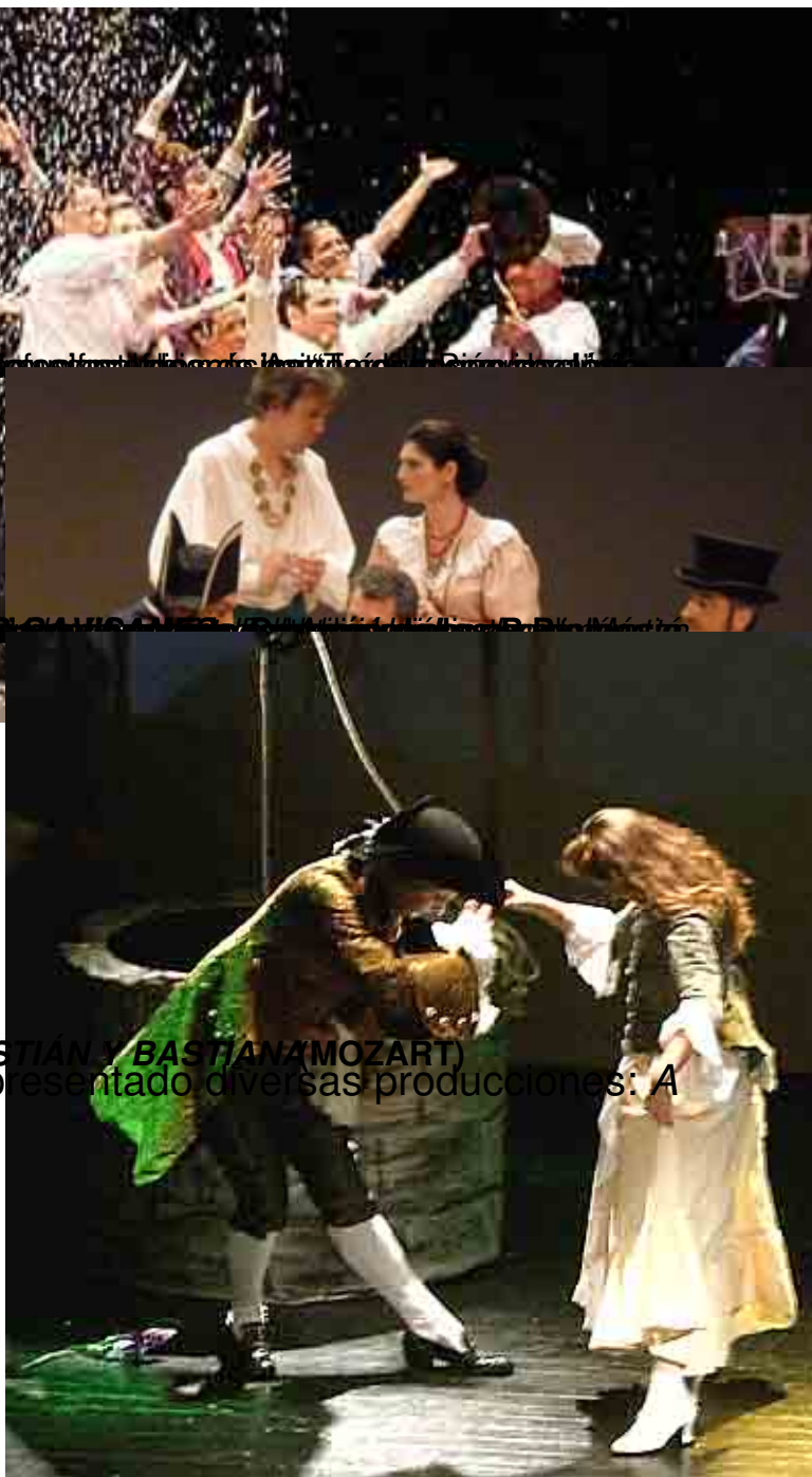
(BASTIÁN Y BASTIANA (MOZART)) Con esas premisas, Innova Lyrica ha presentado diversas producciones: A gua, azucarillos y aguardiente