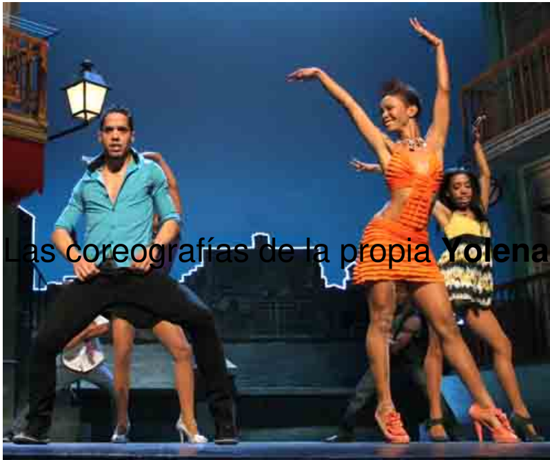
Las coreografías de la propia Yolena suman un total de 10.

Albert Boadella calificaba de redundante el subtítulo El musical de las Pasiones