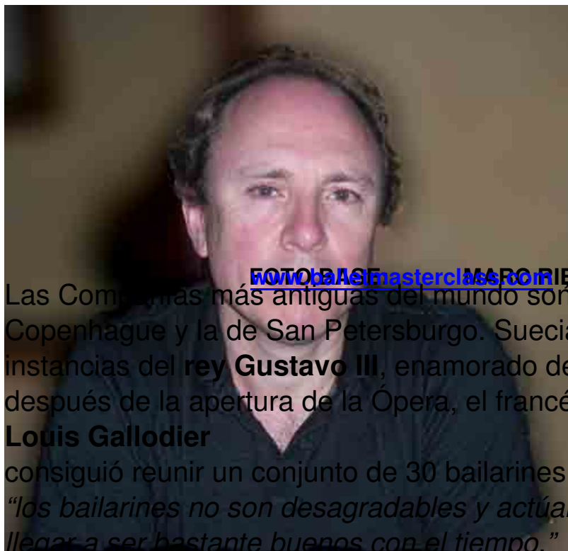
FOTOBASE masterclass.com MARC RIBAUD

Las Compañías más antiguas del mundo son tres: la de París, la de Copenhague y la de San Petersburgo. Suecia se incorpora en 1773 a instancias del rey Gustavo III , enamorado del ballet. Sólo unos meses después de la apertura de la Ópera, el francés