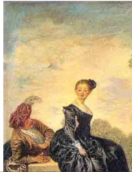
▣ LA BOUDEUSE