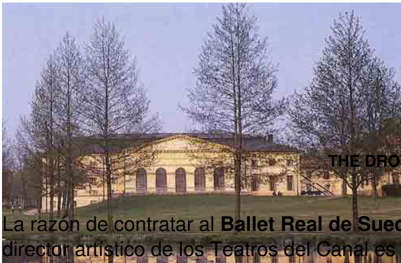
THE DROTTNINGHOLM COURT THEATRE BALLET

· Yo conocía este teatro los Teatros del Canal (1