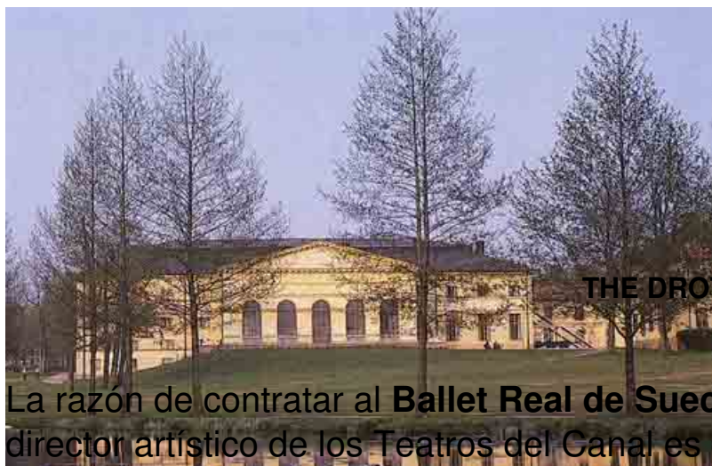
THE DROTTHINGHOLM COURT THEATRE BALLET

· Yo conocía este teatro los Teatros del Canal (1