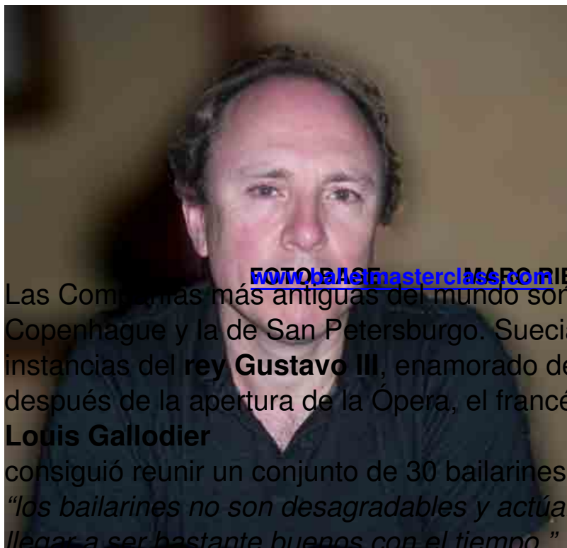
FOTOBASE masterclass.com MARC RIBAUD

Las Compañías más antiguas del mundo son tres: la de París, la de Copenhague y la de San Petersburgo. Suecia se incorpora en 1773 a instancias del rey Gustavo III , enamorado del ballet. Sólo unos meses después de la apertura de la Ópera, el francés