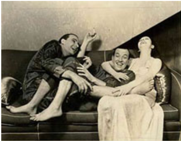
TEATRO ESTRENO 1933