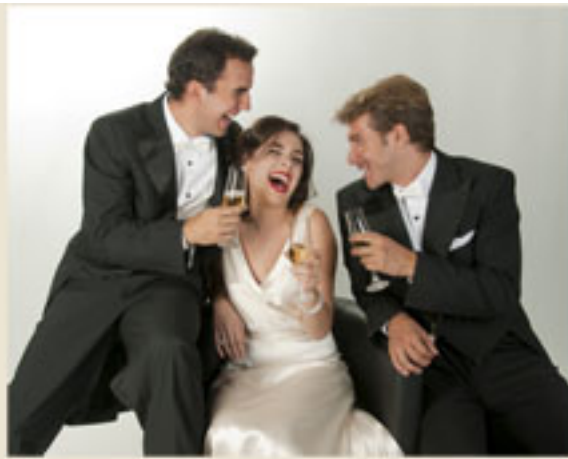
TEATRO GALILEO 2011