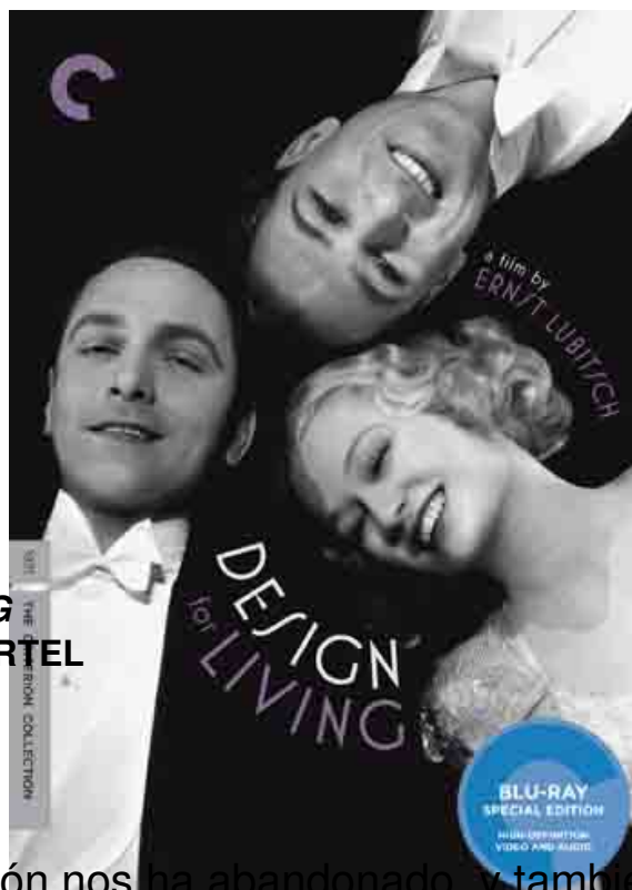
▣ DESIGN FOR LIVING (PELICULA 1933) CARTEL