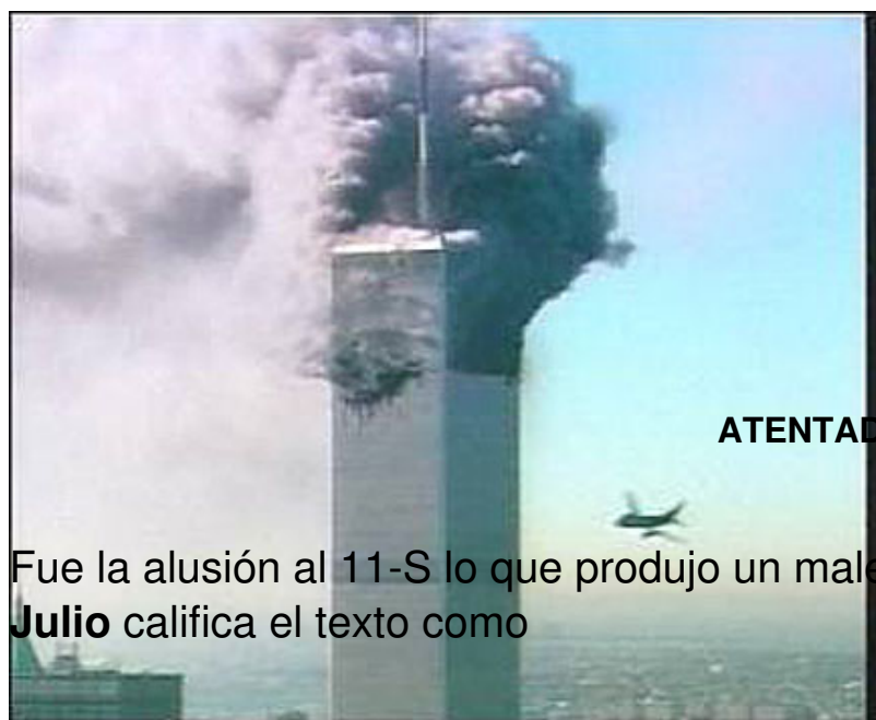
ATENTADO 11 S, NUEVA YORK

Fue la alusión al 11-S lo que produjo un malestar en el Gobierno Americano.