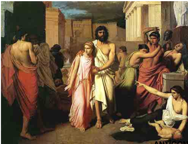
ANTIGONA Y TIRESIAS

Esta Antígona de Mérida abrirá el Festival porque, según Blanca :