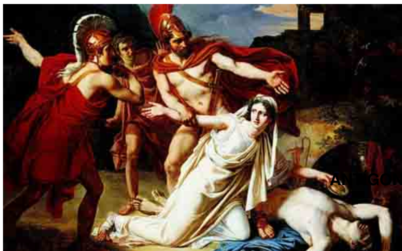
ANTÍGONA Y SU HERMANO

En total hay 3 Antígonas y ello puede parecer extraño o repetitivo. Blanca asegura que no: