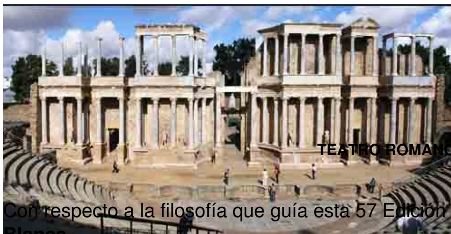
TEATRO ROMANO (MÉRIDA)

Con respecto a la filosofía que guía esta 57 Edición consiste en que, según Blanca