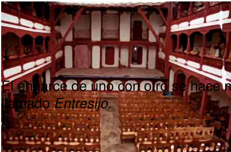
□ CORRAL DE COMEDIAS, ALMAGRO

El engarce de uno con otro se hace mediante lo que se ha llamado Entresijo .