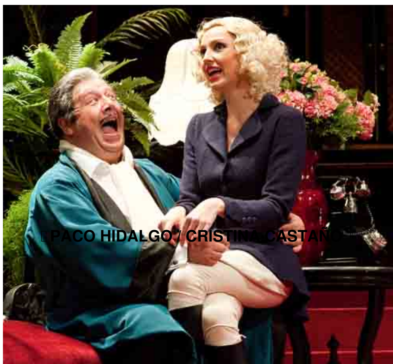
[[PACO HIDALGO/ CRISTINA CASTAÑEDA]]

Estreno en Madrid: Teatro Fernán Gómez (Guirau) , 21 – IX - 2011