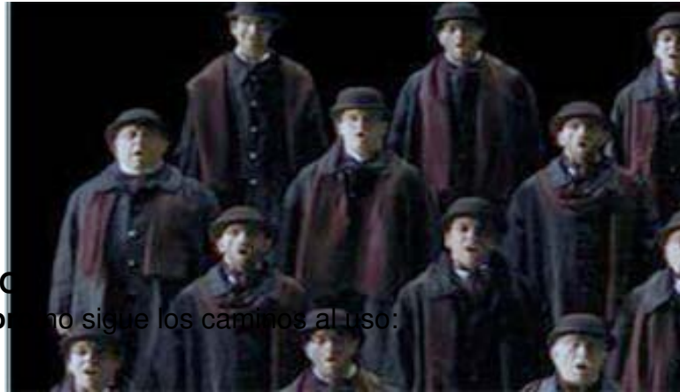
Escénicamente el Coro no sigue los caminos al uso: