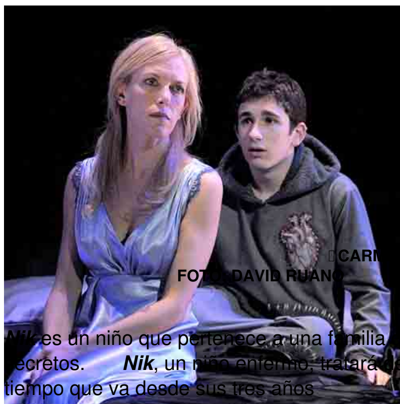
■ CARMEN CONESA / DAVID CASTILLO

Nik es un niño que pertenece a una familia que oculta una serie de secretos. Nik , un niño enfermo, tratará de descubrirlos en un espacio de tiempo que va desde sus tres años hasta los siete años.