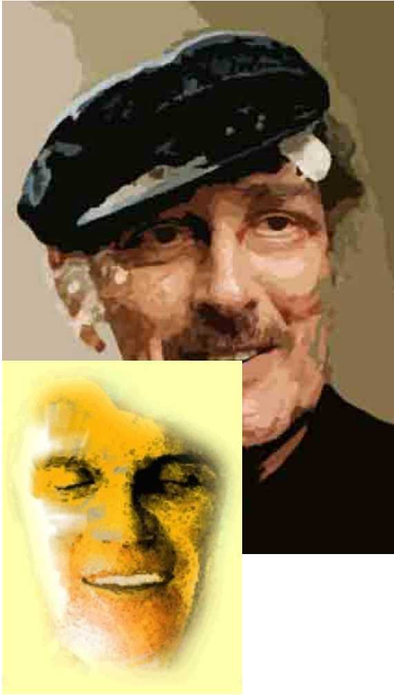
□ HAROLD PINTER □