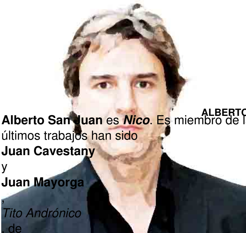
ALBERTO SAN JUAN