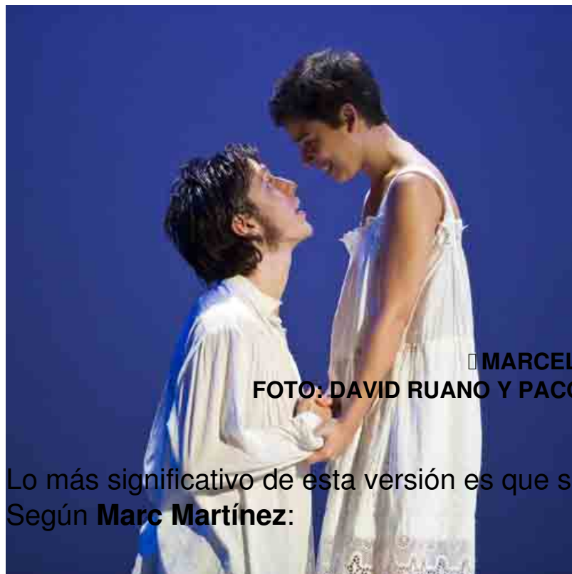
■ MARCEL BORRÁS / CARLOTA OLCINA