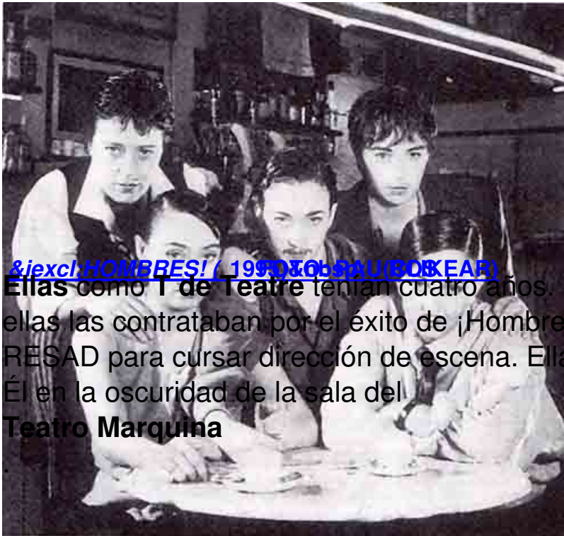
¡HOMBRES! (1990) de T de Teatre