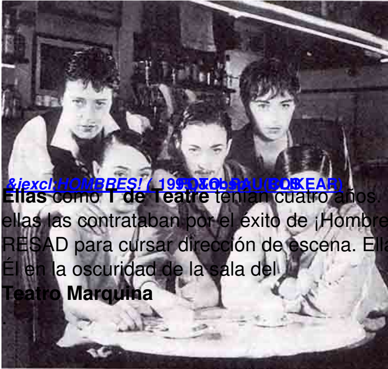
¡HOMBRES! (1990) de T de Teatre