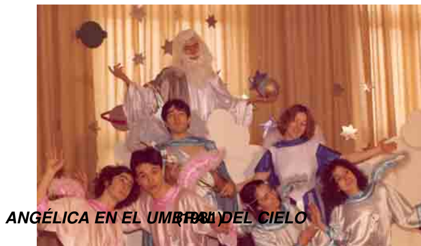
ANGÉLICA EN EL UMBRAL DEL CIELO