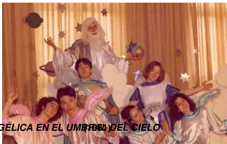
ANGÉLICA EN EL UMBRAL DEL CIELO