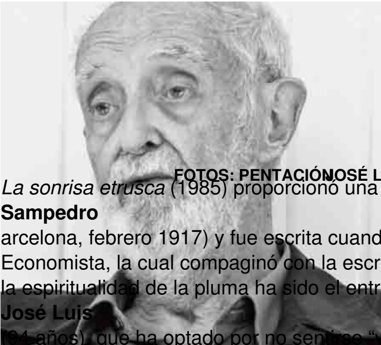
JOSÉ LUIS SAMPEDRO

La sonrisa etrusca (1985) proporcionó una gran popularidad a José Luis Sampedro