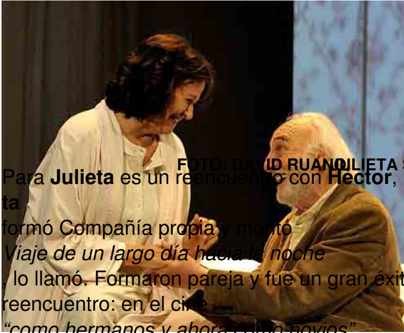
JULIETA SERRANO / HÉCTOR ALTERIO

Para Julieta es un reencuentro con Héctor , pues, ya en 1991, cuando Julie formó Compañía propia y montó Viaje de un largo día hacia la noche lo llamó. Formaron pareja y fue un gran éxito. Después hubo otro reencuentro: en el cine “como hermanos y ahora como novios”