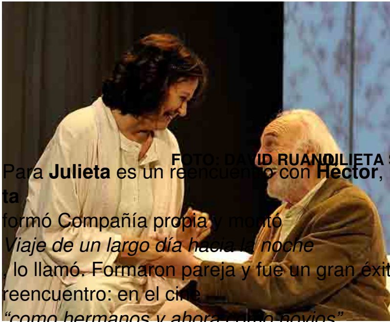
JULIETA SERRANO / HÉCTOR ALTERIO

Para Julieta es un reencuentro con Héctor , pues, ya en 1991, cuando Julie formó Compañía propia y montó Viaje de un largo día hacia la noche lo llamó. Formaron pareja y fue un gran éxito. Después hubo otro reencuentro: en el cine “como hermanos y ahora como novios”