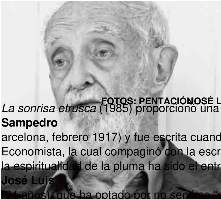
JOSÉ LUIS SAMPEDRO

La sonrisa etrusca (1985) proporcionó una gran popularidad a José Luis Sampedro