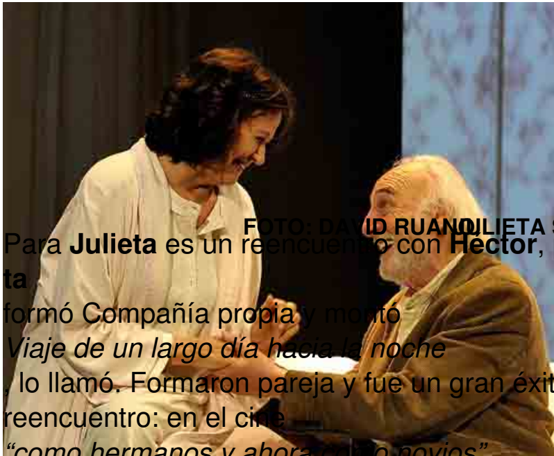
JULIETA SERRANO / HÉCTOR ALTERIO

Para Julieta es un reencuentro con Héctor , pues, ya en 1991, cuando Julie formó Compañía propia y montó Viaje de un largo día hacia la noche lo llamó. Formaron pareja y fue un gran éxito. Después hubo otro reencuentro: en el cine “como hermanos y ahora como novios”