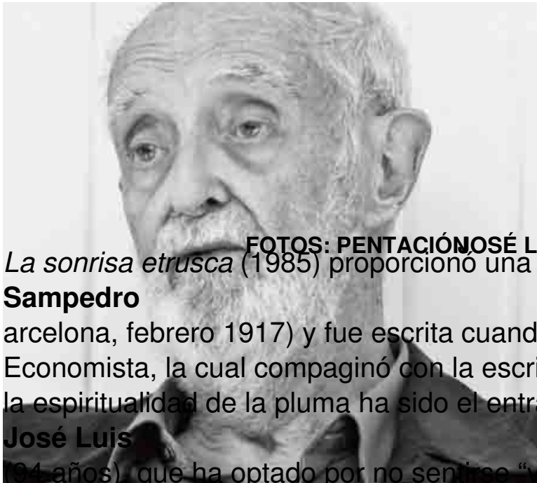
JOSÉ LUIS SAMPEDRO

La sonrisa etrusca (1985) proporcionó una gran popularidad a José Luis Sampedro (Barcelona, febrero 1917) y fue escrita cuando se jubila de su profesión de Economista, la cual compaginó con la escritura. La materialidad del dinero y la espiritualidad de la pluma ha sido el entramado de José Luis Sampedro (84 años), que ha optado por no sentirse “viejo”, según declaraciones en los medios de comunicación, respirando optimismo por la vida y dibujando una “sonrisa” .