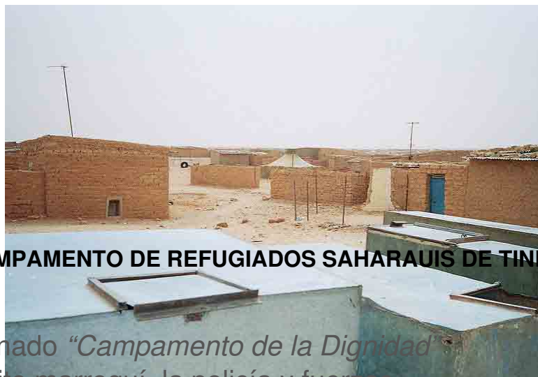
CAMPAMENTO DE REFUGIADOS SAHARAUIS DE TIN

El campamento de Gdeim Izik , denominado “ Campamento de la Dignidad ” fue desalojado, fue atacado por el ejército marroquí, la policía y fuerzas auxiliares. Los altavoces de los 75 camiones cisternas antidisturbios bramaban: