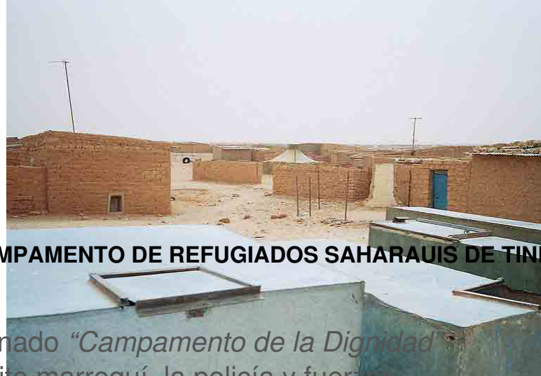
CAMPAMENTO DE REFUGIADOS SAHARAUIS DE TIN

El campamento de Gdeim Izik , denominado “Campamento de la Dignidad” fue desalojado, fue atacado por el ejército marroquí, la policía y fuerzas auxiliares. Los altavoces de los 75 camiones cisternas antidisturbios bramaban: