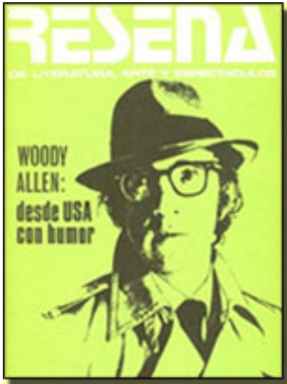
Reseña, marzo 1973