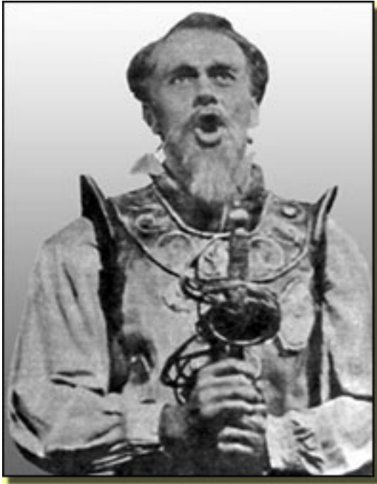
Richard Kiley (Estreno en N.Y.)

Miércoles, 14 de Abril de 2010 14:56 - Actualizado Jueves, 13 de Mayo de 2010 13:47