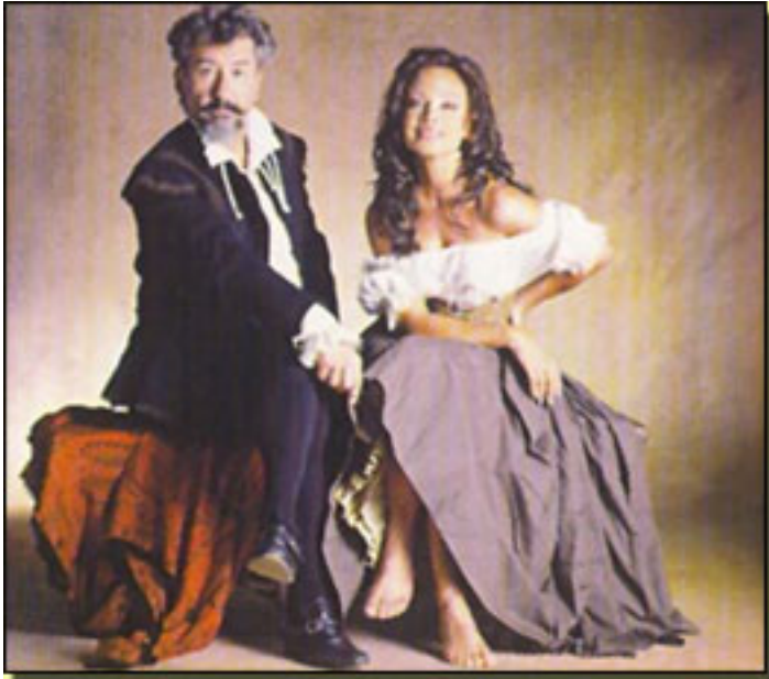
José Sacristán y Paloma San Basilio

Miércoles, 14 de Abril de 2010 14:56 - Actualizado Jueves, 13 de Mayo de 2010 13:47