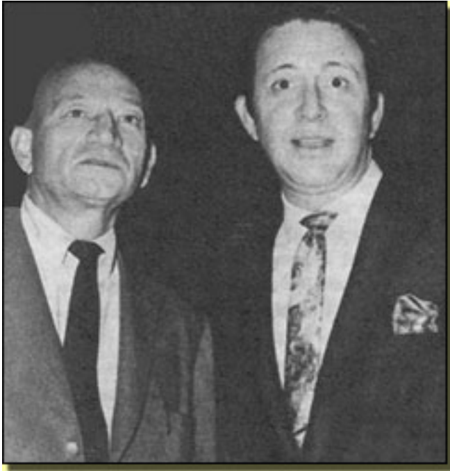
Dale Wasserman y Mitch Leigh

Miércoles, 14 de Abril de 2010 14:56 - Actualizado Jueves, 13 de Mayo de 2010 13:47