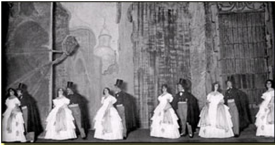
Decorado 1923 (Manuel Fontanals) Coro de románticos