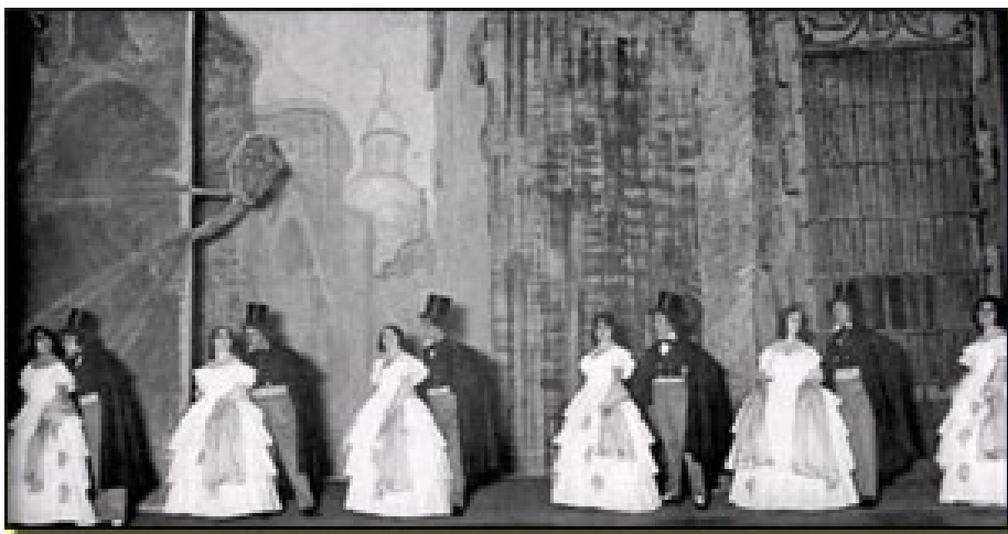
Decorado 1923 (Manuel Fontanals) Coro de románticos