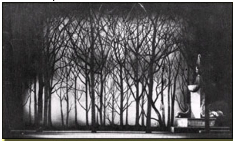
Decorado 1956. (Emilio Burgos) Coro de románticos

A esas alturas casi había fenecido en su formato tradicional y adocenado. Tamayo le aplicó el tratamiento de gran espectáculo. Decorados de bulto y con cierta prestancia del entonces afamado Emilio Burgos , “ballets” integrados en la línea argumental y la masa coral como protagonista. Los preludios e intermedios se visualizaban con el cuerpo de baile. Se le aplicó una dirección escénica. Un nuevo tenor,