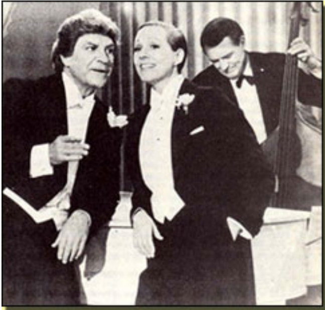
ROBERT PRESTON/JULIE ANDREWS

La siguiente década, la de los sesenta, Claude Rains