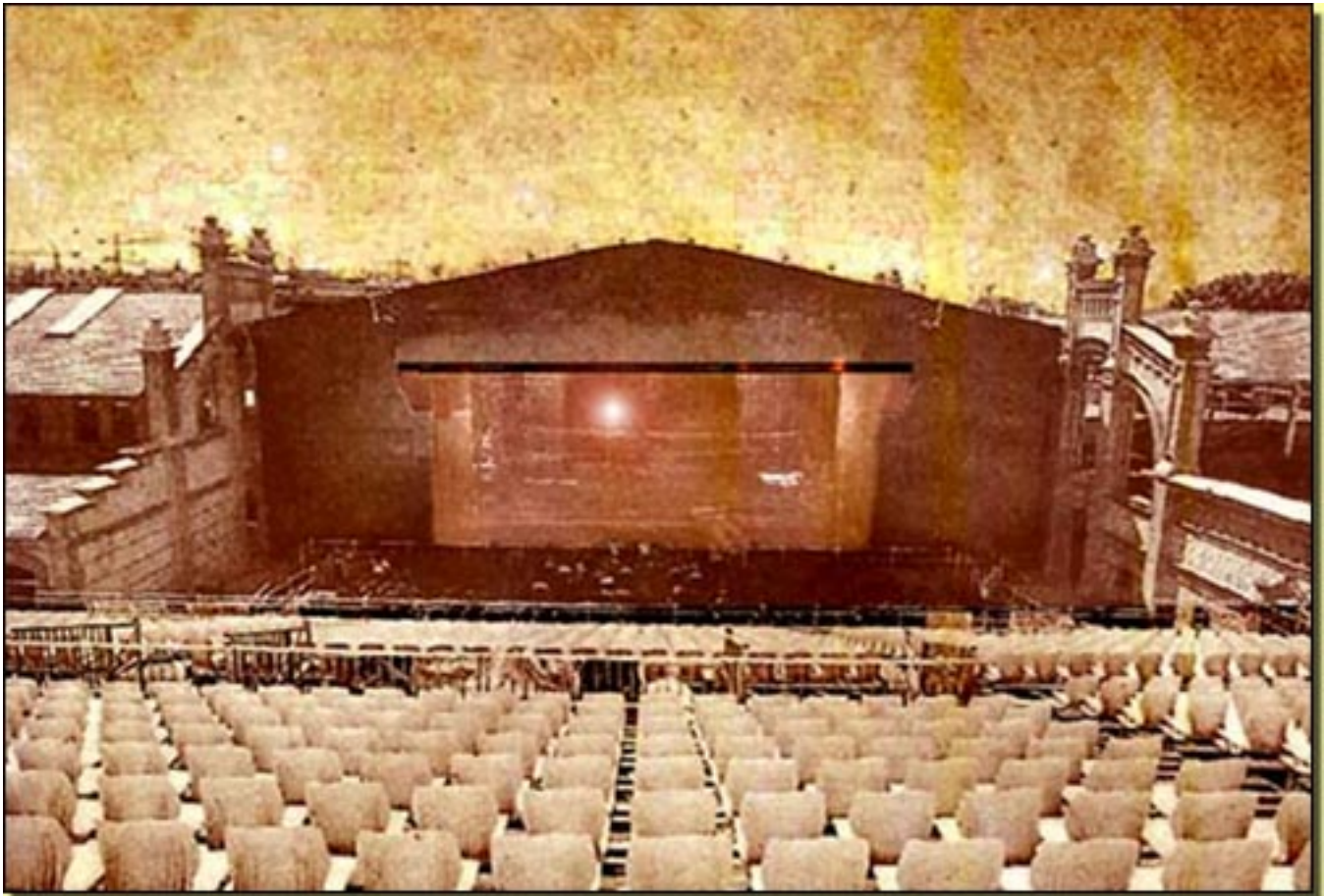
ESCENARIO MONTADO EN LAS DEPENDENCIAS DEL MATADERO