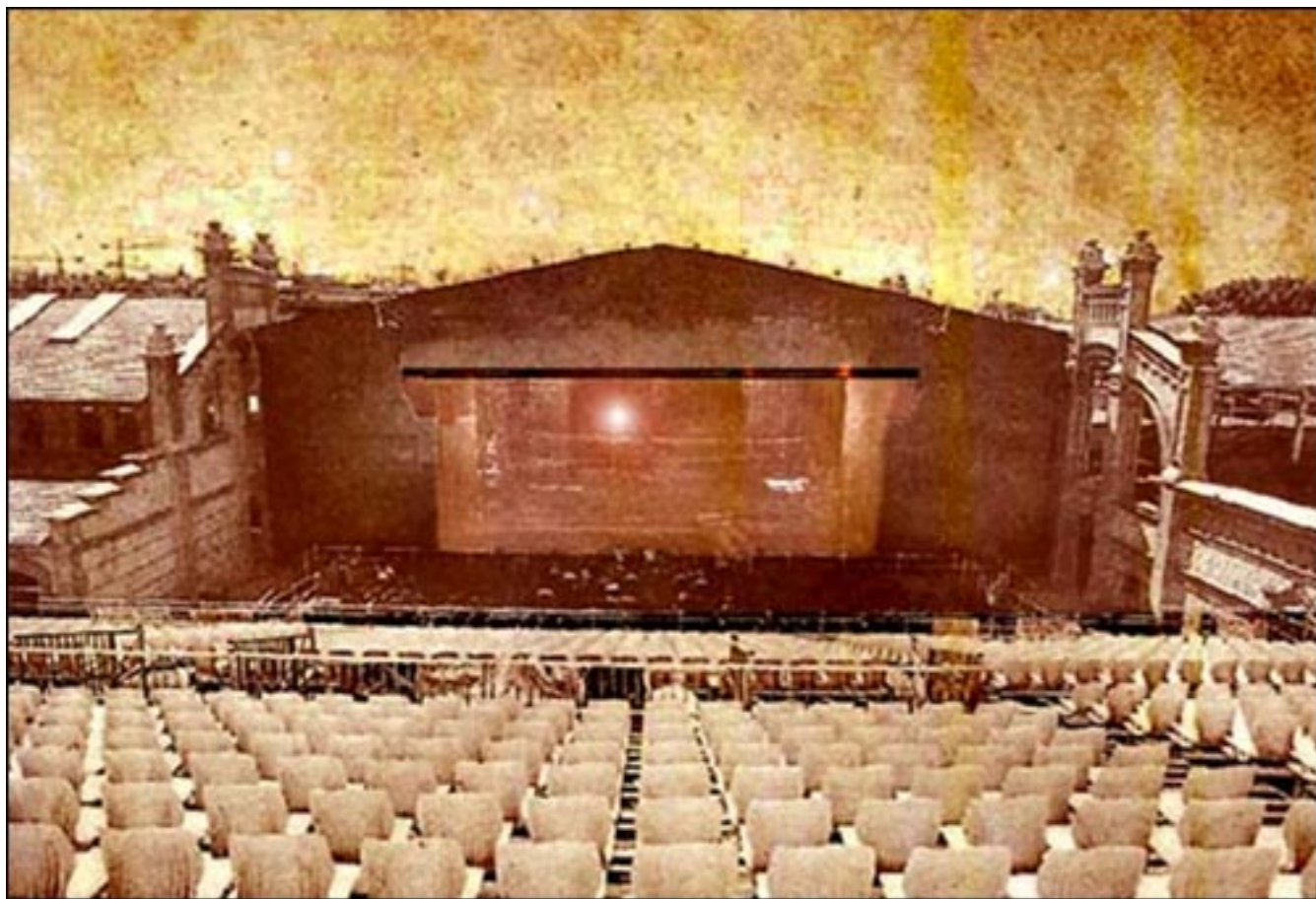
ESCENARIO MONTADO EN LAS DEPENDENCIAS DEL MATADERO