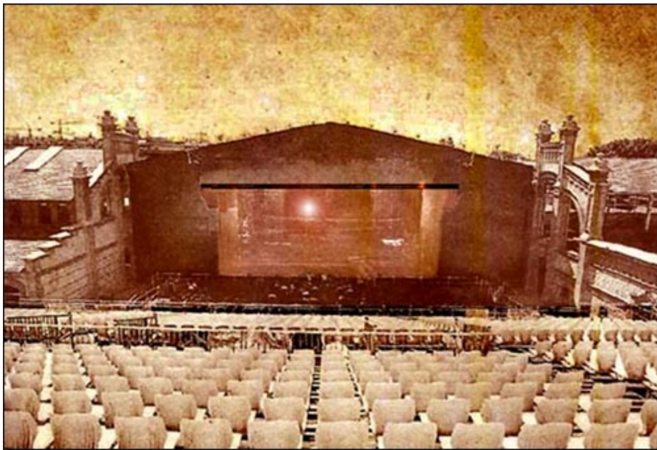
ESCENARIO MONTADO EN LAS DEPENDENCIAS DEL MATADERO