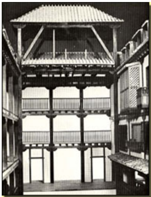
CORRAL DEL PRÍNCIPE (MAQUETA DE JORGE BRUNET Modificación: ENRIQUE