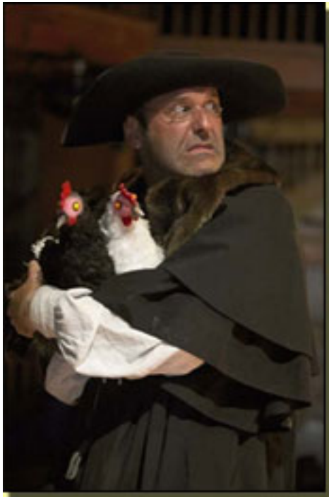
PEDRO DE URDEMALAS (ROYAL SHAKESPEARE COMPANY)

Con Cervantes llegaron a la escena mujeres graciosas, soldados famélicos y apicarados, renovadas celestinas, esposas adúlteras, maridos cornudos y contentos, aventureros, escribanos oportunistas, sacristanes, estudiantes aguafiestas y farsantes, héroes truculentos como Pedro de Urdemalas